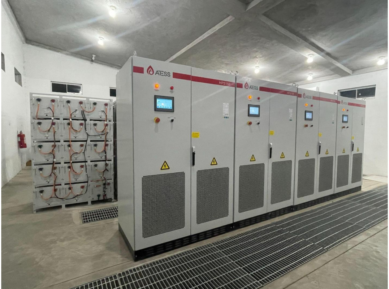
Sistema de almacenamiento de energía en baterías (BESS, abreviatura en inglés) de ATESS de 540 kW y 1.666 kWh en Bretaña, Perú