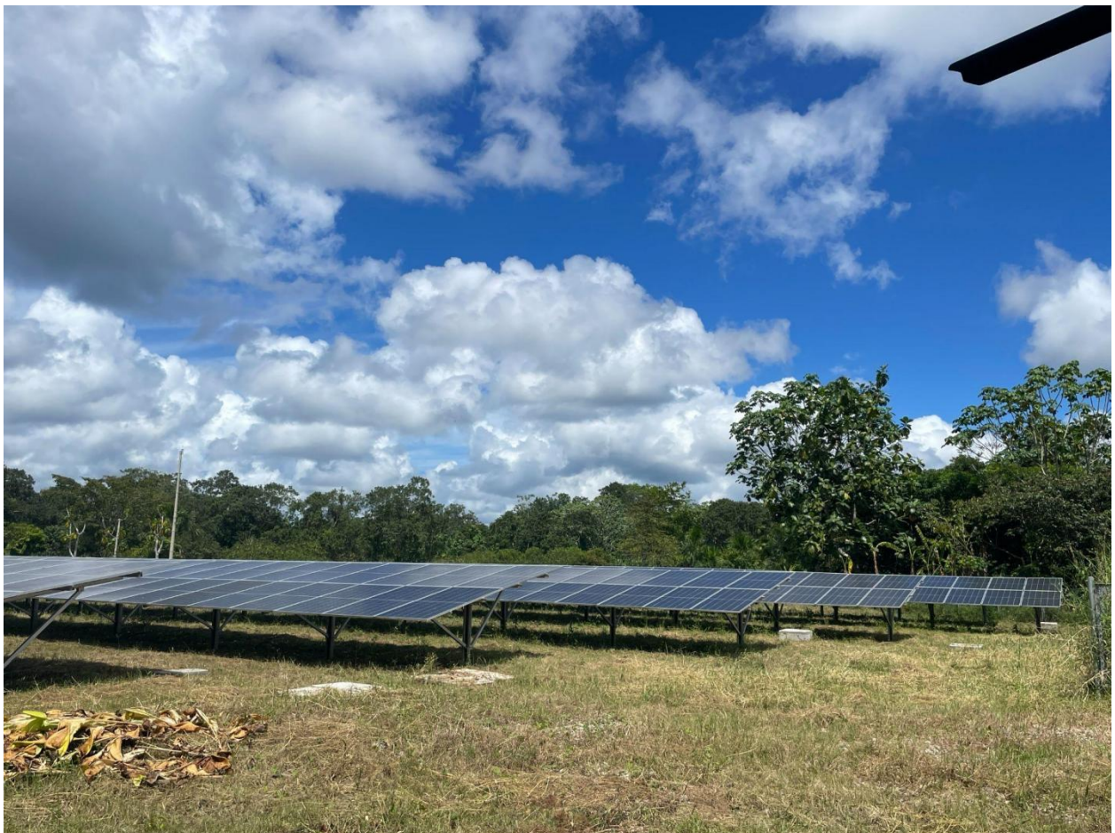
El sistema fotovoltaico instalado en Bretaña integrado con el sistema de almacenamiento de energía en baterías (BESS) de ATESS

La comunidad de Bretaña sufría grave escasez de energía. Con el comienzo de las operaciones en la central eléctrica Bretaña, la disponibilidad de energía ha aumentado exponencialmente, registrando un aumento estimado del 50% en la demanda de carga. Se espera que esta trayectoria de crecimiento continúe, impulsada por la expansión de la infraestructura y las actividades económicas en la región.