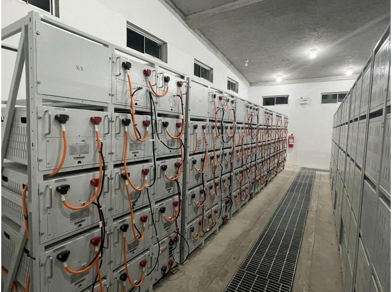
Un total de 16 juegos de bastidores de baterías instalados para el proyecto Bretaña